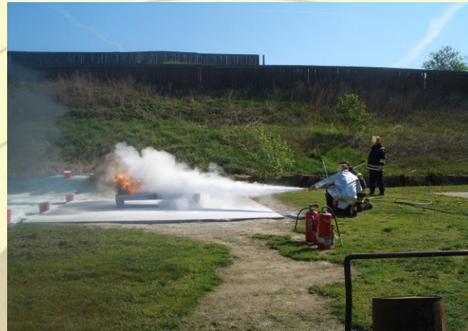
Einweisung für Brandschutzhelfer / praktische Löschübung

Durch Kontakte zu Kooperationspartnern der Wirtschaft werden durch die SECOMA Academy GmbH vakante Praktikumsplätze akquiriert. Weiterhin bieten wir Unterstützungsleistungen bei der Vermittlung von Vorstellungsgesprächen und bei der Beantragung von Integrationszuschüssen beim jeweils zuständigen Arbeitsvermittler an.